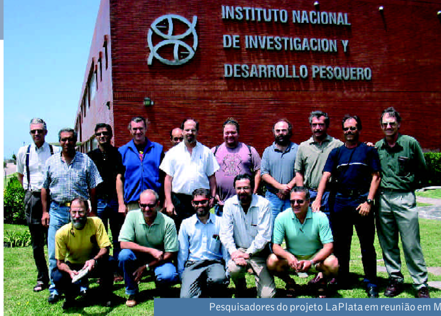
Pesquisadores do projeto LaPlata em reunião em Mar del Plata, em 2004, às vésperas do segundo cruzeiro.

Diretor do Instituto Oceanográfico da USP